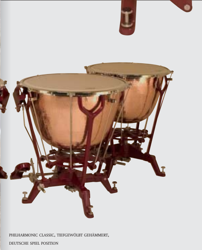
PHILHARMONIC CLASSIC, TIEFGEWÖLBT GEHÄMMERT, DEUTSCHE SPIEL POSITION