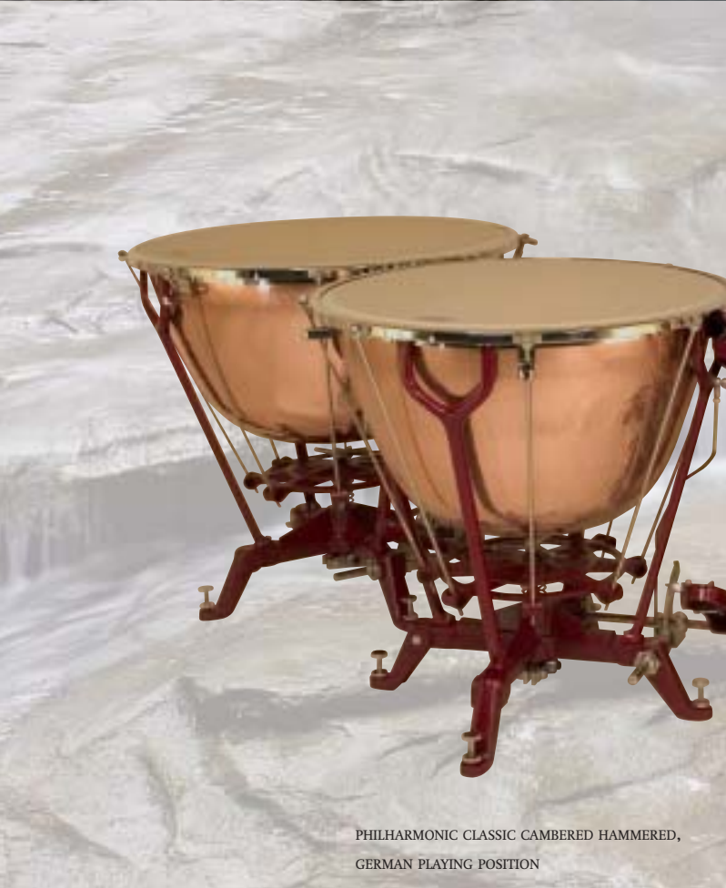
PHILHARMONIC CLASSIC CAMBERED HAMMERED, GERMAN PLAYING POSITION