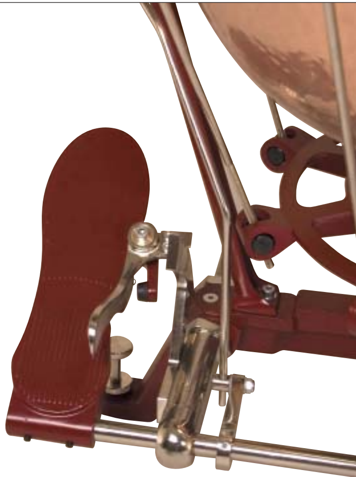
RATCHET STYLE PEDAL | FEINZAHNKRANZ PEDALSYSTEM

Neu in der Adams Pauken Serie ist die "Philharmonic Classic" Pauke. Dieses kompakte Instrument ist mit einem Pedal in der klassischen und ursprünglichen Feinzahnkranz-Mechanik ausgestattet. Die "Philharmonic Classic" Pauke verfügt über unser neu entworfenes und patentiertes, geteiltes Kipparm-system. Diese einzigartige Konstruktion verringert den enormen Druck auf Paukengestell und Kessel, und verhindert damit ein Verziehen oder Verformen dieser Instrumententeile. Ein weiterer großer Vorteil der "Philharmonic Classic" Pauke ist, dass das Verbindungsteil zur vorderen Achse mit Nocken nicht mehr benötigt wird.