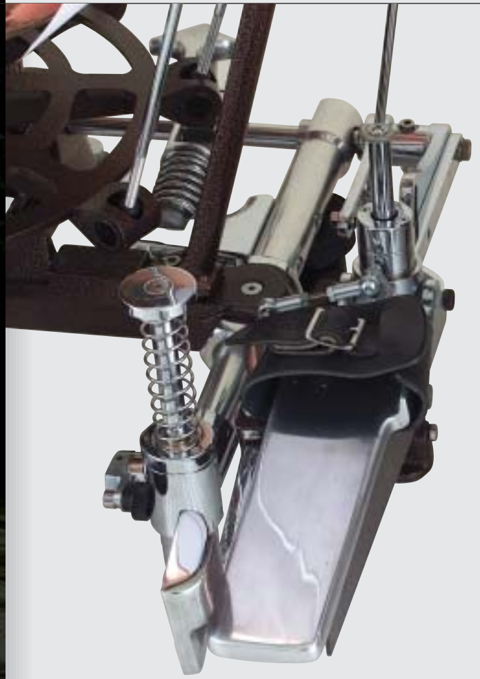
BERLIN STYLE PEDAL | BERLIN PEDALSYSTEM

New in line is the Philharmonic Classic. This model has a pedal mechanism with the old style ratchet, a very basic system like the old days. This model featured our re-designed patented split rocker arm system. The amazing design decreases the pressure on the frame of the timpani, preventing any flex or changes in the frame or bowl shape. No extra transfer bar for connection from the front axle to the cam. The unique split rocker arm is completely mounted on the front side of the timpani. A very nice design with ratchet tuning pedal.