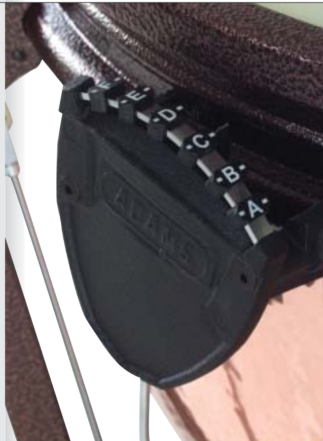
▲ TUNING GAUGE | STIMMANZEIGER