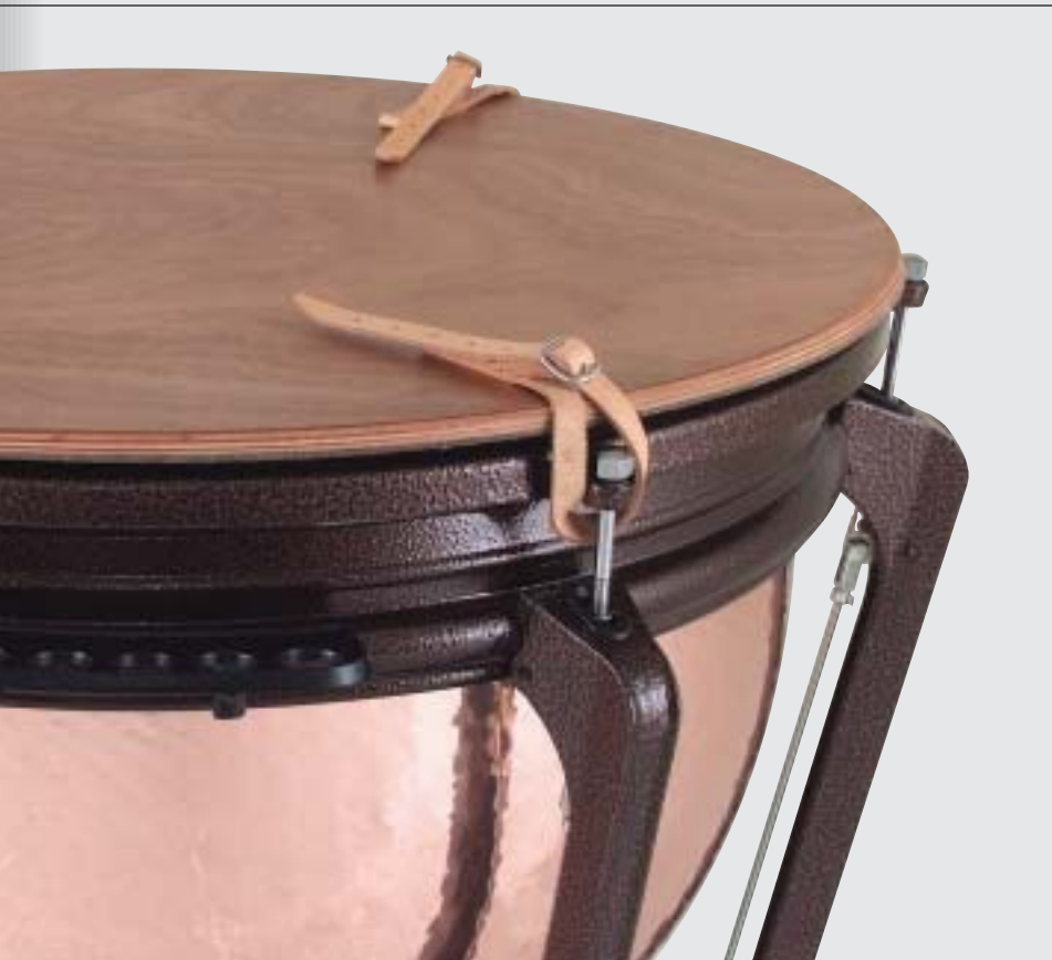
▲ DISK | FELL-SCHUTZ-DECKEL