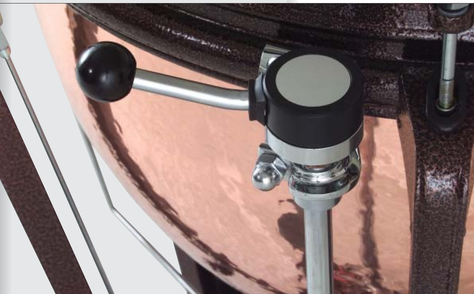
▼ FINE TUNER | FEINSTIMMER